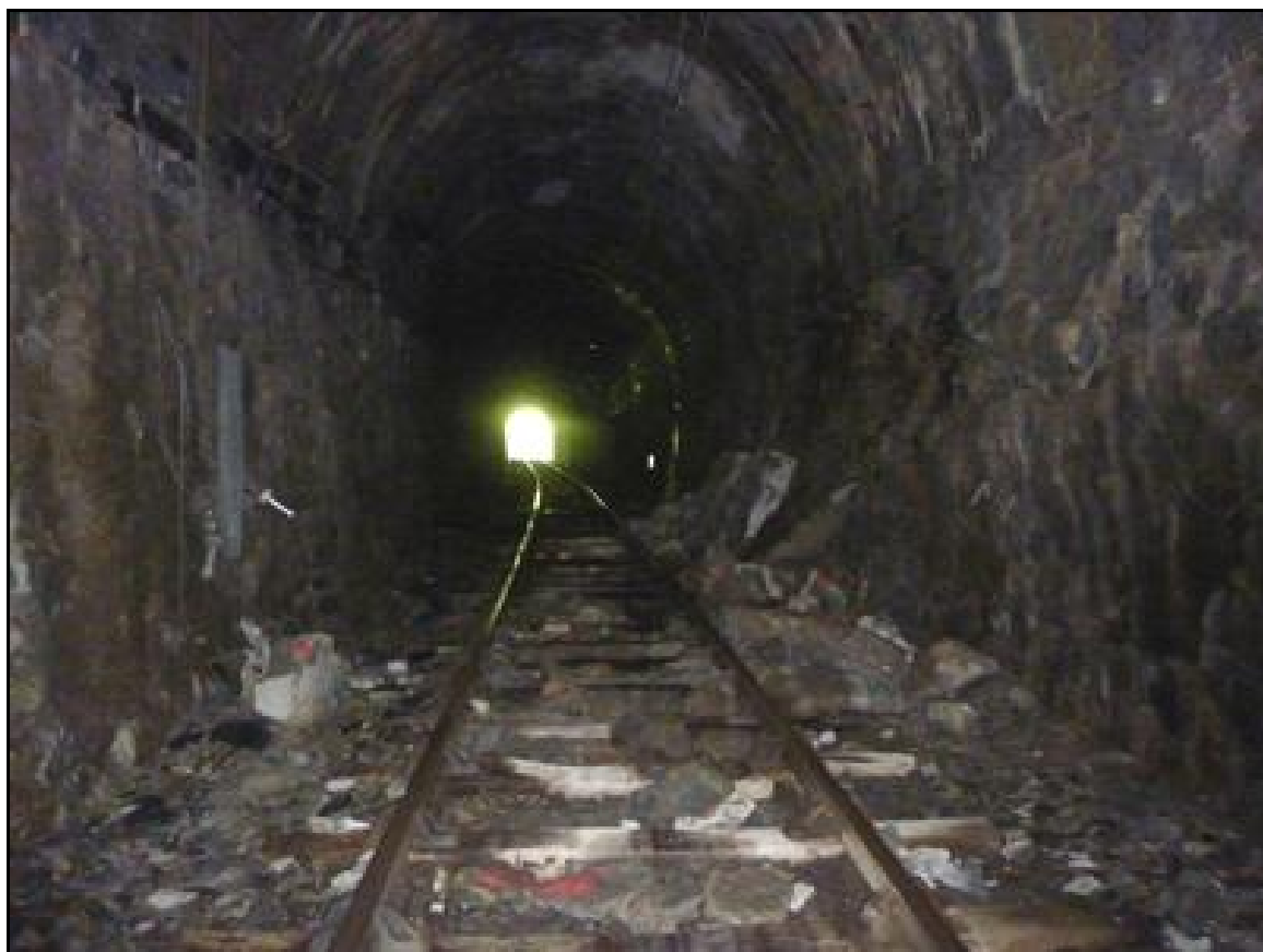
Le triste état de la galerie avec ses piédroits effondrés