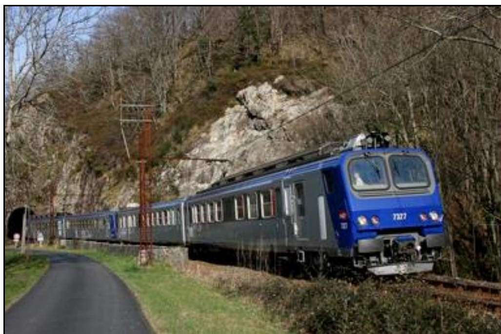
Un train à destination de Saint Jean Pied de Port sort du tunnel de Errobisola

Si cette fiche comporte des erreurs ou des oublis, merci de nous le signaler.