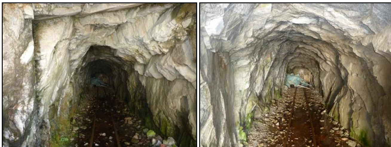
La galerie borgne et murée

Si cette fiche comporte des erreurs ou des oublis, merci de nous le signaler.