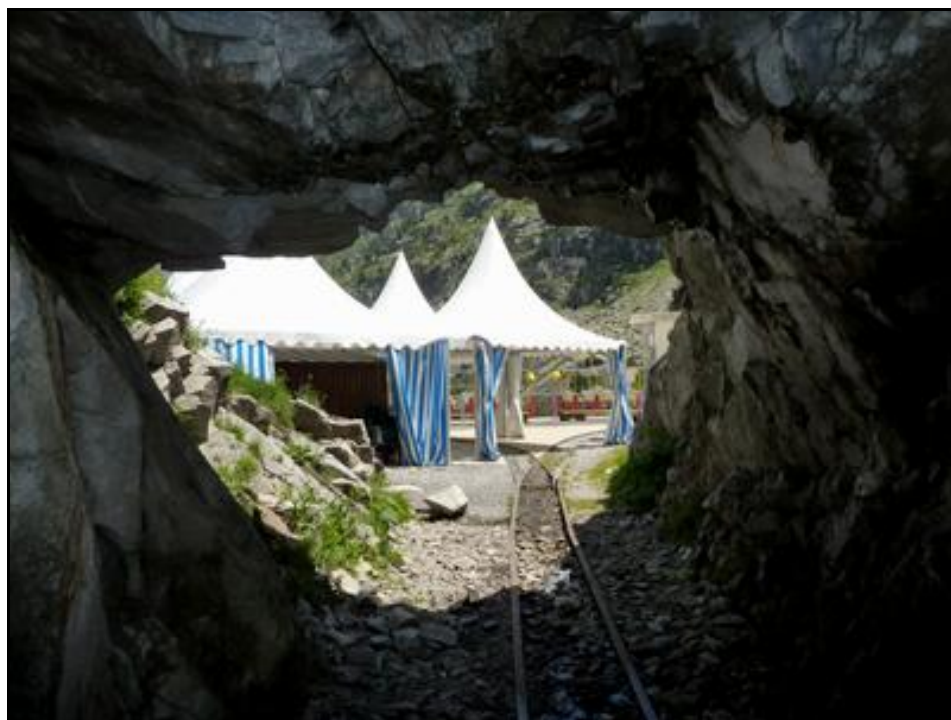
A l'arrière-plan, la gare d'arrivée du petit train touristique