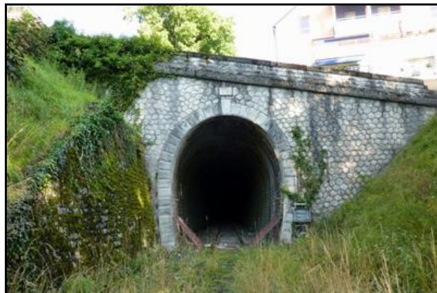
L'entrée et la sortie du tunnel aujourd'hui