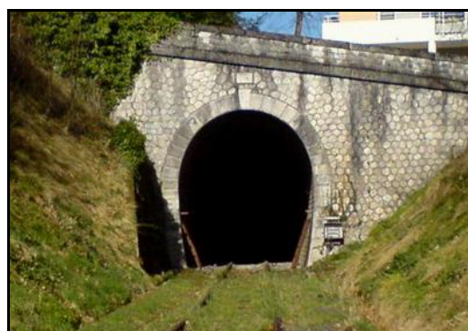
L'entrée et la sortie du tunnel après une inutile opération de débroussaillage