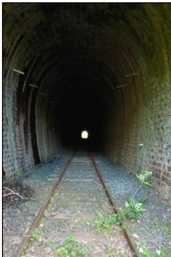
La galerie et ces curieux drains rajoutés après fin de l'exploitation

Si cette fiche comporte des erreurs ou des oublis, merci de nous le signaler.