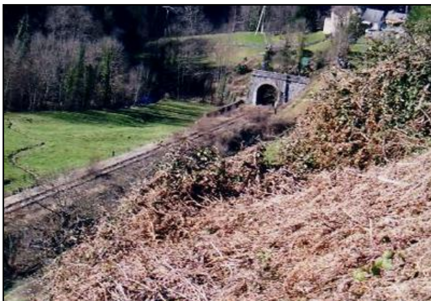
Sortie du souterrain de Lagaüde sous les maisons du village d'Urdos

Si cette fiche comporte des erreurs ou des oublis, merci de nous le signaler.