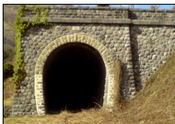
Ci-dessus et ci-dessous, l'entrée et la sortie du tunnel en d'autres temps