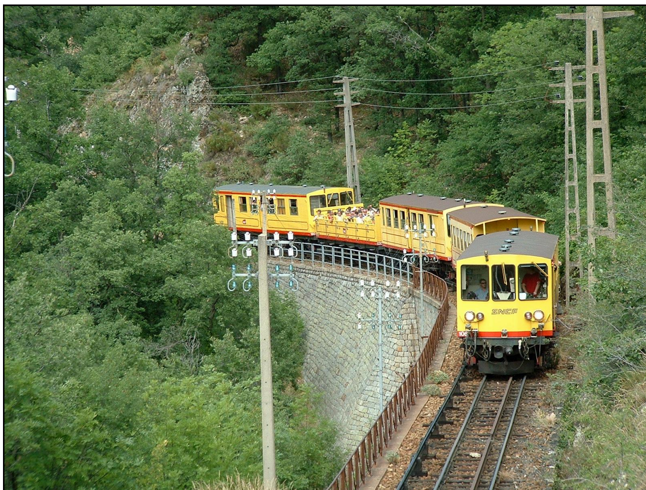
Le train jaune avec sa « baignoire » (la voiture découverte)

Alimentée par troisième rail électrifié, cette ligne commerciale régulière est la seule de France à mettre des voitures découvertes à disposition de ses voyageurs.