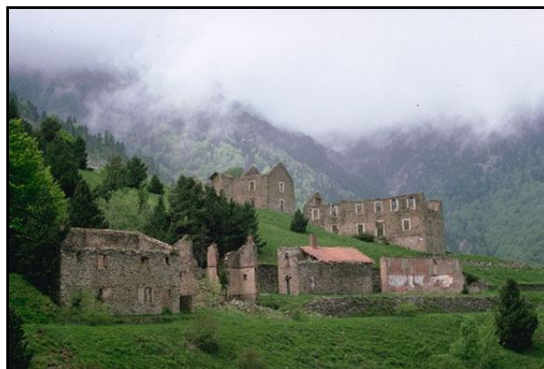
Les mines de Rapaloum au temps de l'exploitation et aujourd'hui