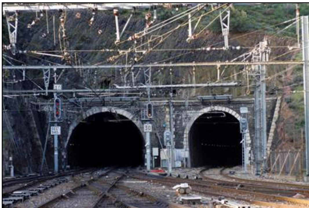
Ci-dessus et ci-dessous, entrées des tunnels de Balitre borgne (à droite) et de Balitre (à gauche), n° 66048.2