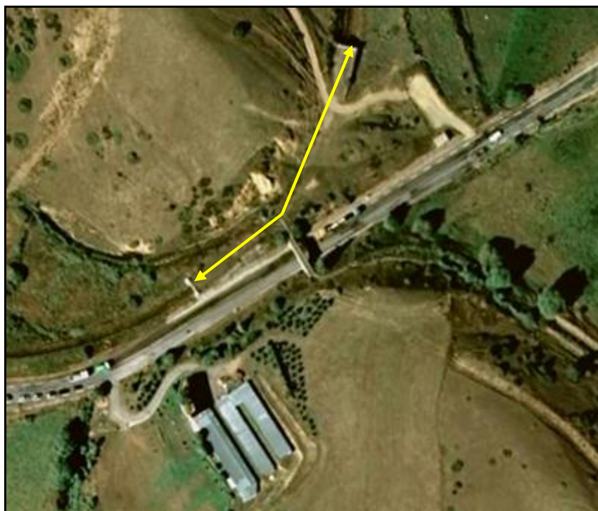
Vue aérienne de la galerie

Si cette fiche comporte des erreurs ou des oublis, merci de nous le signaler.