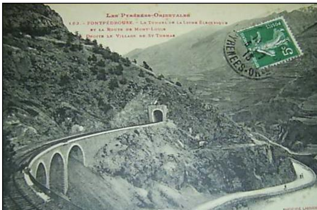
L'entrée du tunnel de Coste Littge, peu de temps après la mise en service de la ligne

Si cette fiche comporte des erreurs ou des oublis, merci de nous le signaler.