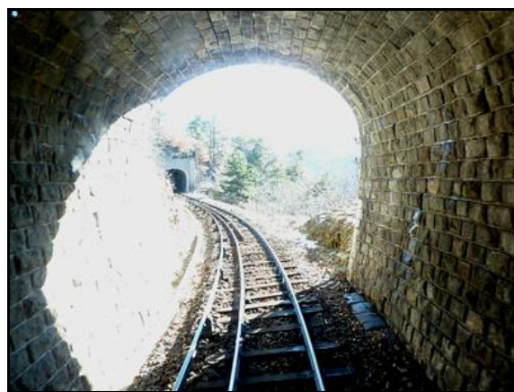
La sortie vue de l'intérieur avec l'entrée du tunnel de Naheille en arrière-plan