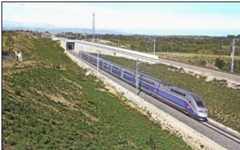
Le saut de mouton aujourd'hui en service

Si cette fiche comporte des erreurs ou des oublis, merci de nous le signaler.