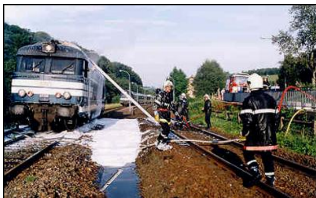
La machine en feu dans la gare de Tieffenbach