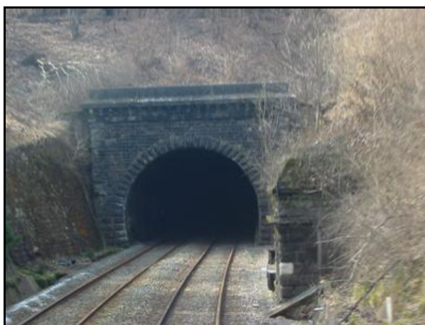
La sortie du tunnel est défendue par un blockhaus que l'on entraperçoit ici à droite