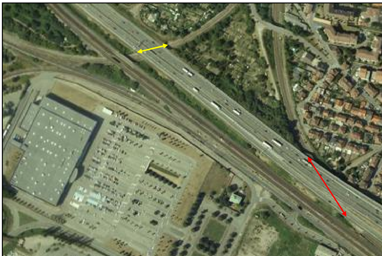
Vue aérienne des deux faux tunnels du nœud de Schiltigheim A gauche, double flèche jaune, la galerie de Schiltigheim 1 A droite, double flèche rouge, la galerie de Schiltigheim 2

Si cette fiche comporte des erreurs ou des oublis, merci de nous le signaler.