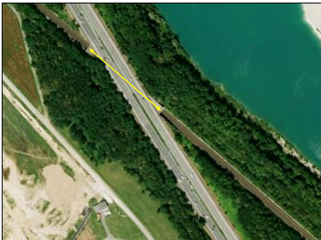
Vue aérienne de la galerie sous l'autoroute A 35

Si cette fiche comporte des erreurs ou des oublis, merci de nous le signaler.