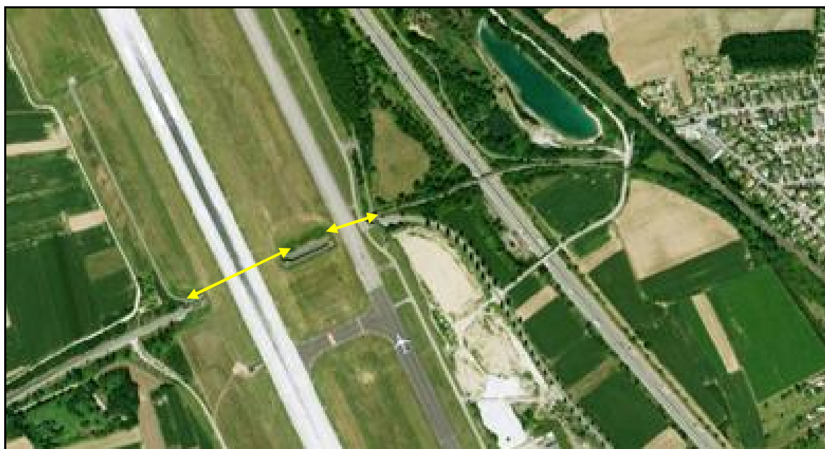
Vue aérienne des deux galeries de l'aéroport Mulhouse Bâle A gauche, la galerie 1 ; et à droite, la galerie 2

Si cette fiche comporte des erreurs ou des oublis, merci de nous le signaler.