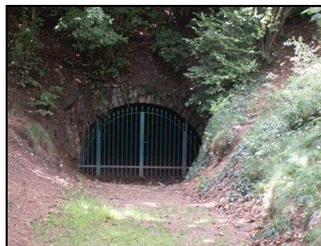
Les tunnels de Panissières et de Longessaigne