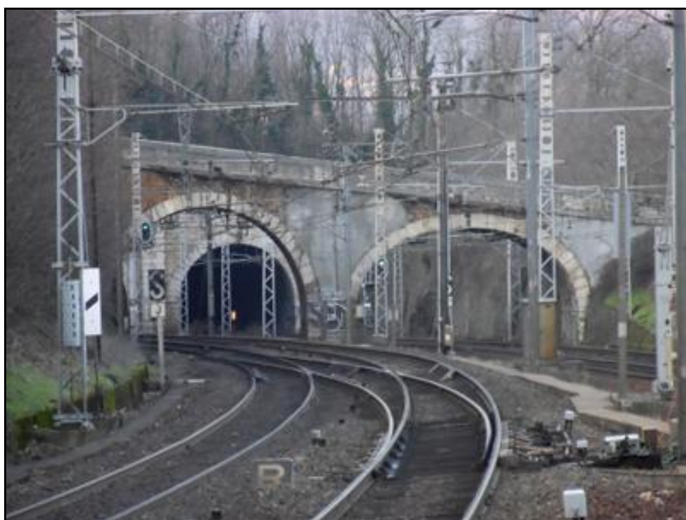
Dans un entrelacs de voies, de pont et de poteaux, la sortie de la galerie Est

Si cette fiche comporte des erreurs ou des oublis, merci de nous le signaler.