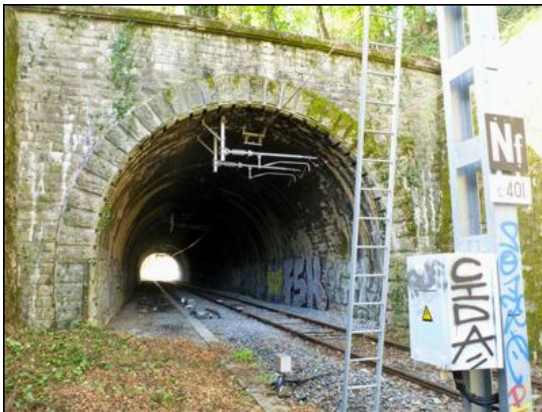
Ci-dessus et ci-dessous, deux photos de la galerie