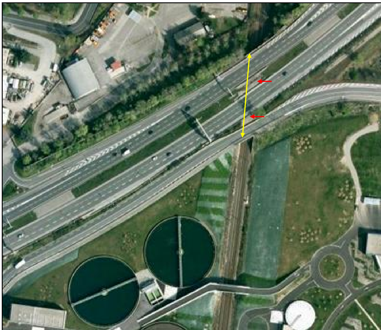
Photo aérienne de la galerie d'Yvours La photo montre bien les ponts des deux voies autoroutières ainsi que d'une bretelle annexe réunis par des toits (flèches rouges) formant galerie sur la voie ferrée

Si cette fiche comporte des erreurs ou des oublis, merci de nous le signaler.