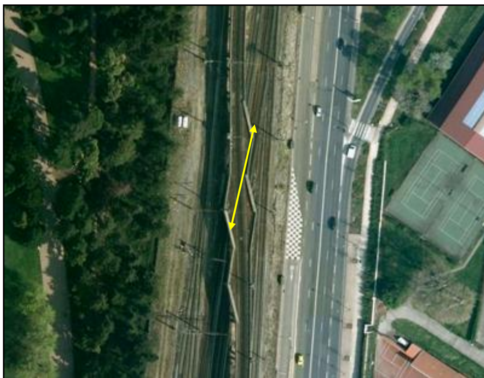
Vue aérienne du saut de mouton de la Tête d'Or 1

Si cette fiche comporte des erreurs ou des oublis, merci de nous le signaler.