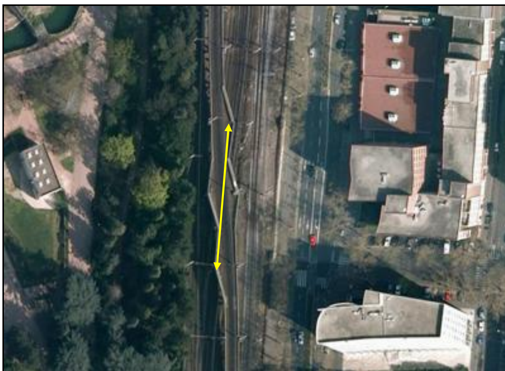
Vue aérienne du saut de mouton de la Tête d'Or 2

Si cette fiche comporte des erreurs ou des oublis, merci de nous le signaler.