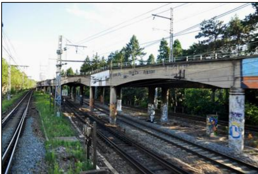
Vues d'une voie parallèle, les deux « galeries » qui composent le saut de mouton de la Tête d'Or 2