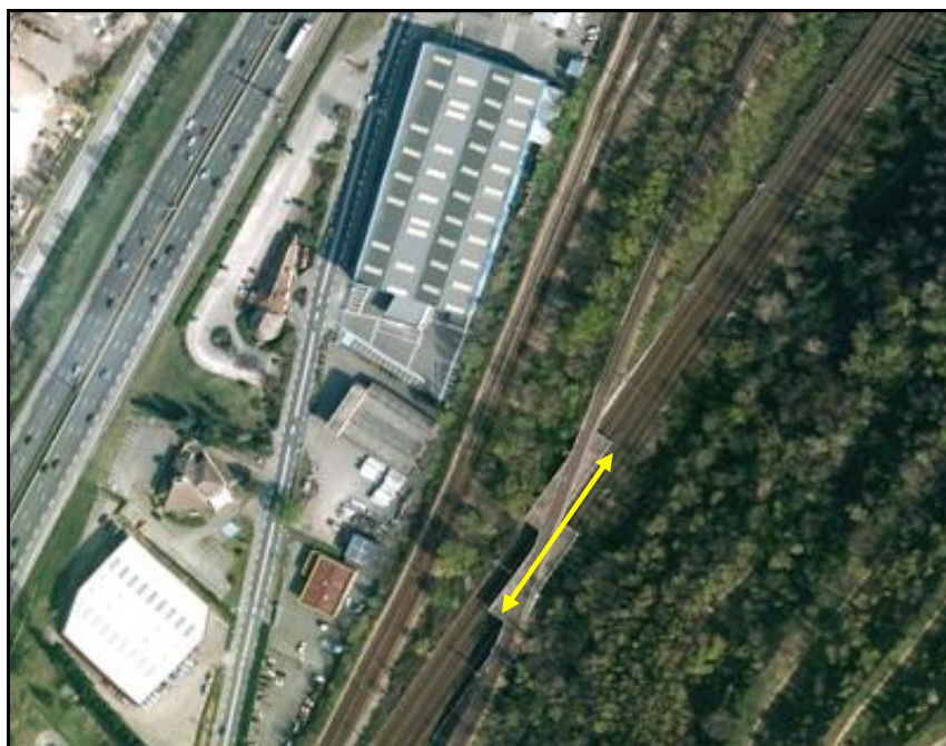
Vue aérienne du saut de mouton de Sibelin Sud