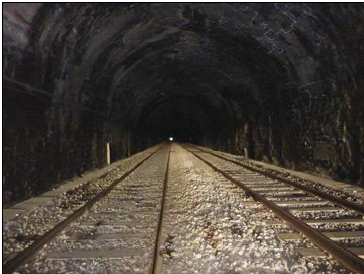
Ci-dessus et ci-dessous, la galerie du tunnel