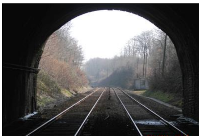
L'entrée et la sortie du tunnel vues de l'intérieur