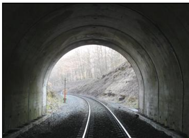
Entrée et sortie vues de l'intérieur

Si cette fiche comporte des erreurs ou des oublis, merci de nous le signaler.