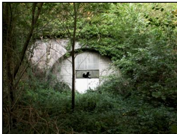
La sortie du tunnel, abandonnée et totalement noyée dans la verdure