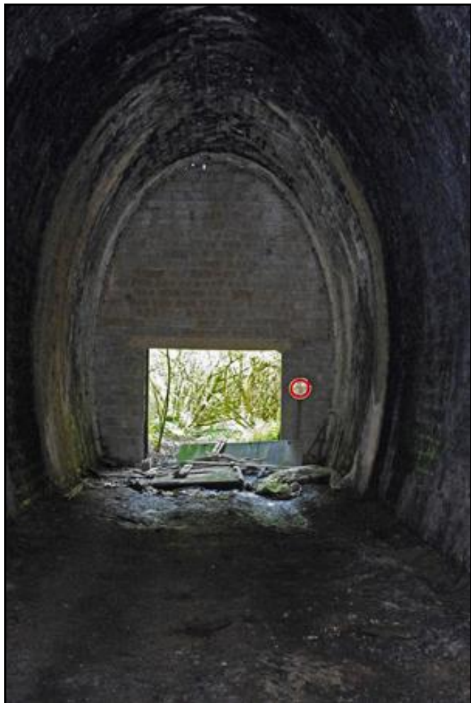
Ci-contre, l'entrée vue de l'intérieur dans son état actuel