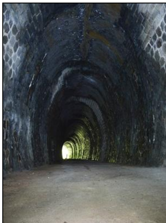
Ci-dessus et ci-dessous, diverses vues de la galerie en bon état général