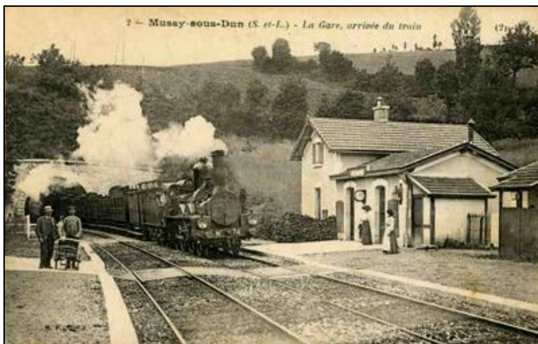
Carte postale ancienne montrant la gare de Mussy et la sortie du tunnel du temps où la ligne possédait encore ses deux voies