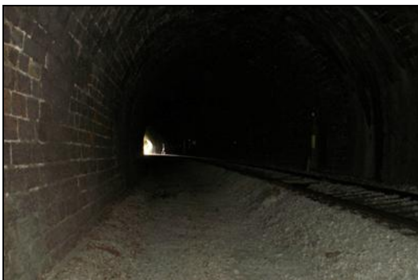
La galerie ; le tunnel initialement prévu pour deux voies n'en possède plus qu'une