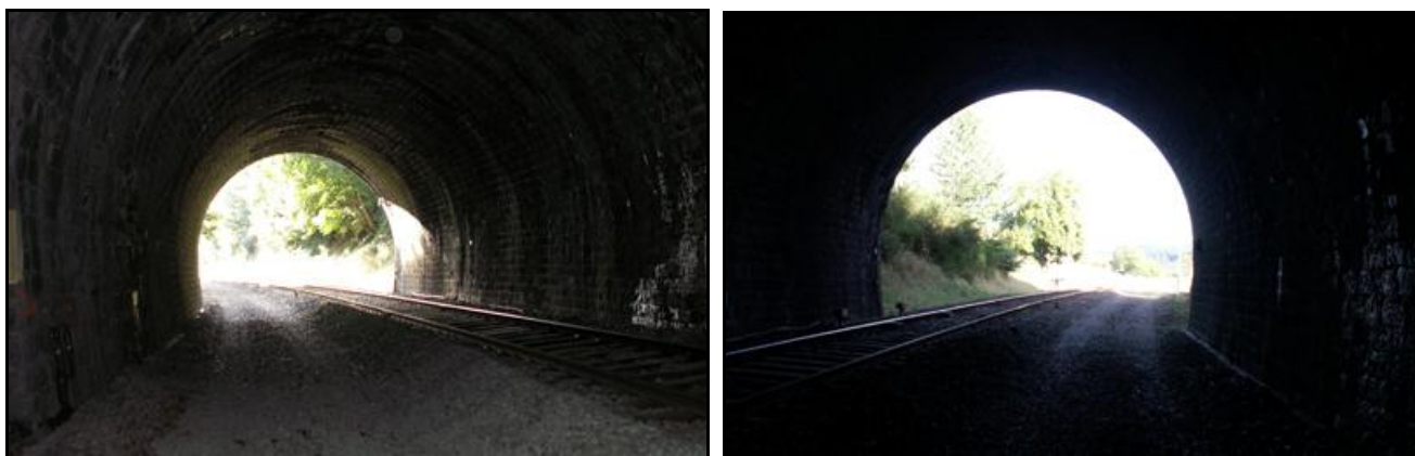
L'entrée et la sortie du tunnel vues depuis l'intérieur de la galerie