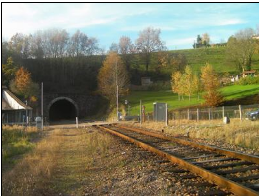
Photo actuelle prise au même endroit La gare a disparu mais on devine encore le quai sur la droite

Si cette fiche comporte des erreurs ou des oublis, merci de nous le signaler.