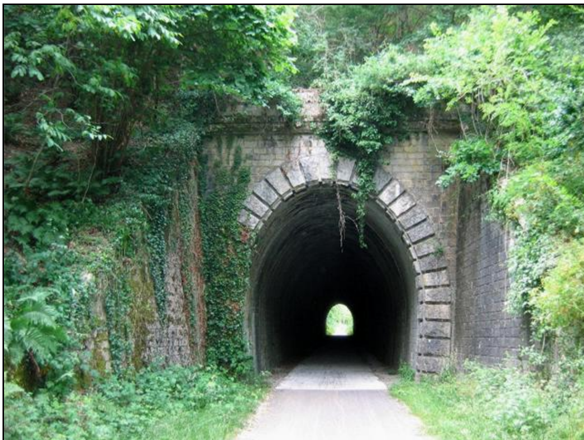
La sortie du tunnel après aménagement de la Voie Verte

Si cette fiche comporte des erreurs ou des oublis, merci de nous le signaler.