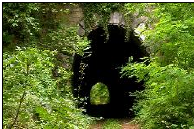
Le tunnel avant aménagement de la Voie Verte