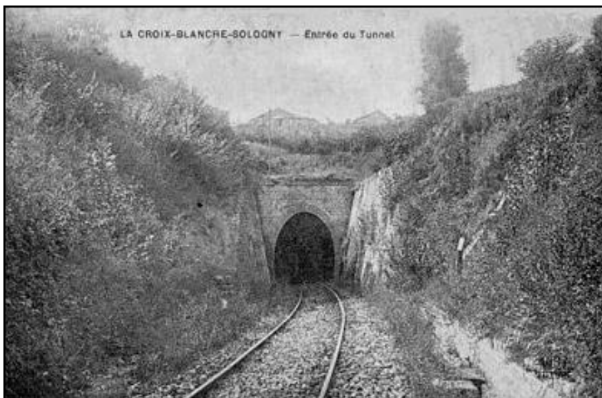
La sortie du tunnel du temps où la ligne était encore en service

Si cette fiche comporte des erreurs ou des oublis, merci de nous le signaler.