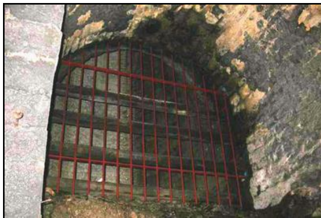
L'ouverture discrète de la cheminée centrale d'aération de 86 m de profondeur et son débouché dans l'un des piédroits du tunnel