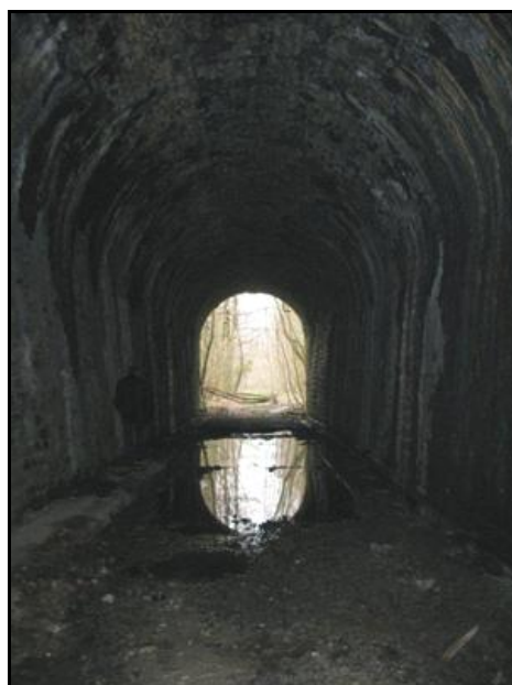
L'entrée et la sortie vues de l'intérieur