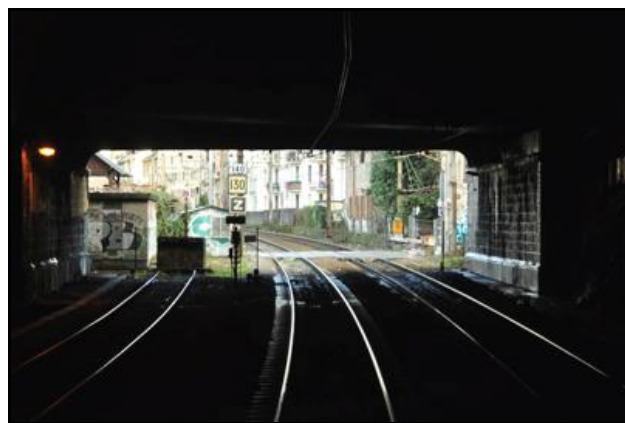
L'intérieur de la galerie A gauche, en regardant vers l'entrée ; à droite, en regardant vers la sortie

Si cette fiche comporte des erreurs ou des oublis, merci de nous le signaler.