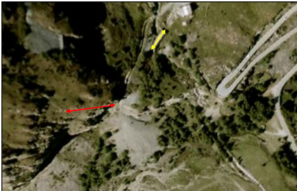
Vue aérienne des deux ouvrages de Saint Nicolas Flèche jaune : galerie paraneige de Saint Nicolas 1 Flèche rouge : vrai petit tunnel de Saint Nicolas 2

Si cette fiche comporte des erreurs ou des oublis, merci de nous le signaler.