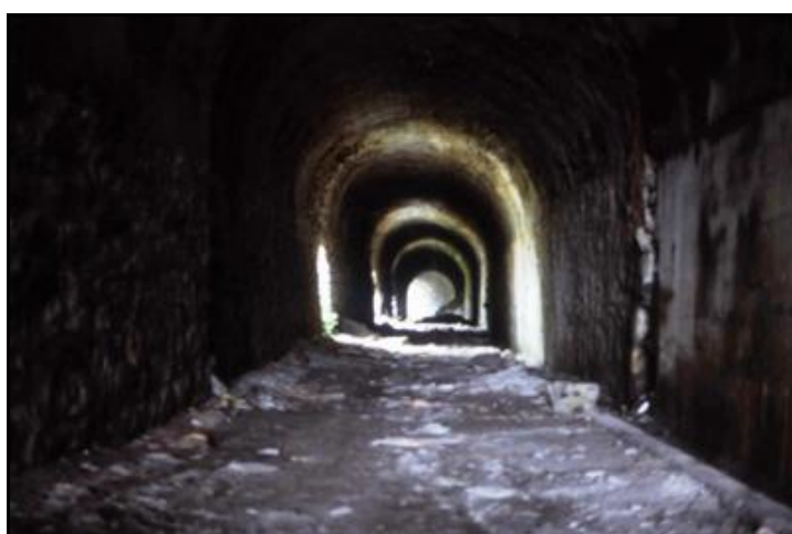
Et ci-dessous, l'intérieur de la galerie dans laquelle donnent quelques fenêtres d'aération