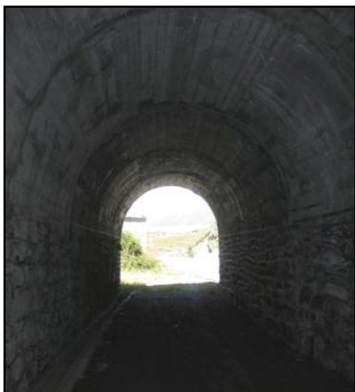
Ci-contre, l'entrée vue de l'intérieur