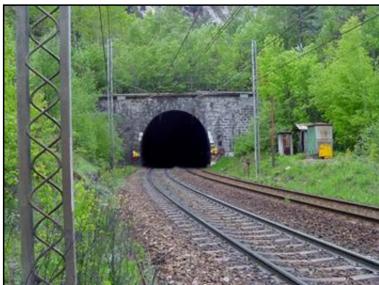
L'entrée du tunnel avant mise au gabarit pour le ferroutage

Si cette fiche comporte des erreurs ou des oublis, merci de nous le signaler.