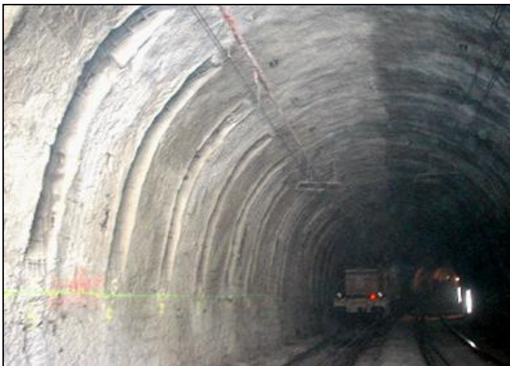
L'élargissement de la galerie et l'encastrement des renforts en béton ici bien visibles