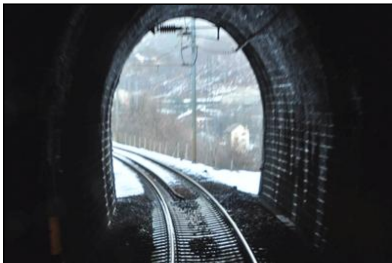
La sortie vue de l'intérieur par temps hivernal

Si cette fiche comporte des erreurs ou des oublis, merci de nous le signaler.