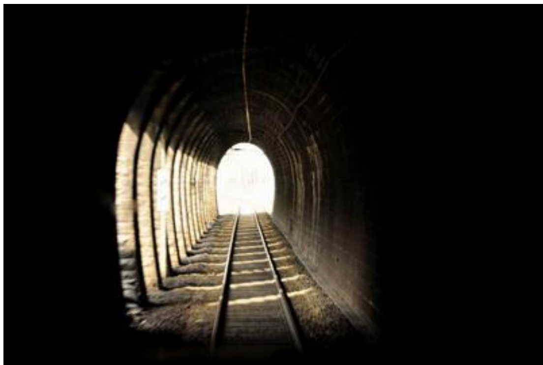
Gros plan sur la galerie de protection d'entrée avec ses arcades latérales

Si cette fiche comporte des erreurs ou des oublis, merci de nous le signaler.