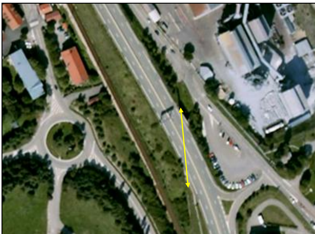
Vue aérienne du faux tunnel

Quelqu'un a pris mon visage. Qui prendra mon derrière ?