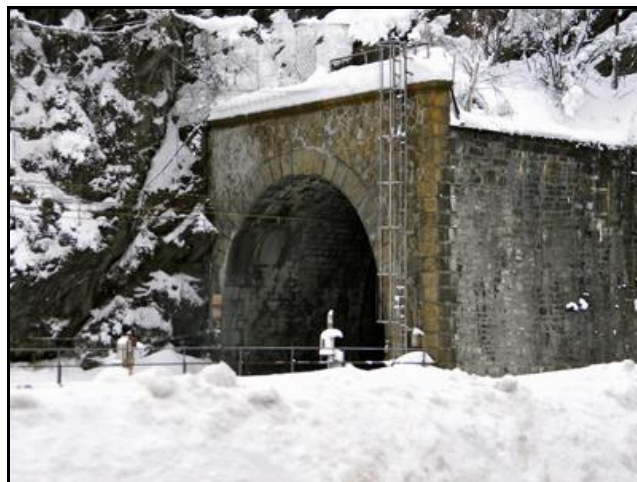
Le tunnel sous la neige

Si cette fiche comporte des erreurs ou des oublis, merci de nous le signaler.