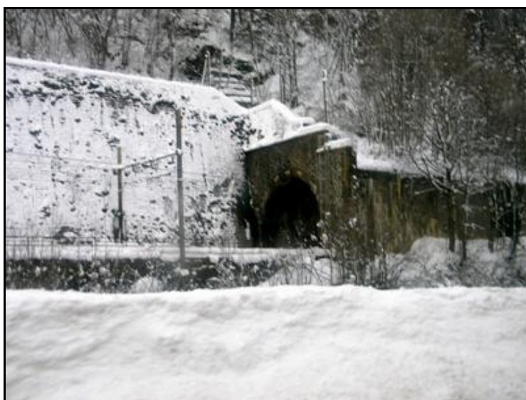
La sortie du tunnel sous la neige

Quelqu'un a pris mon visage. Qui prendra mon derrière ?