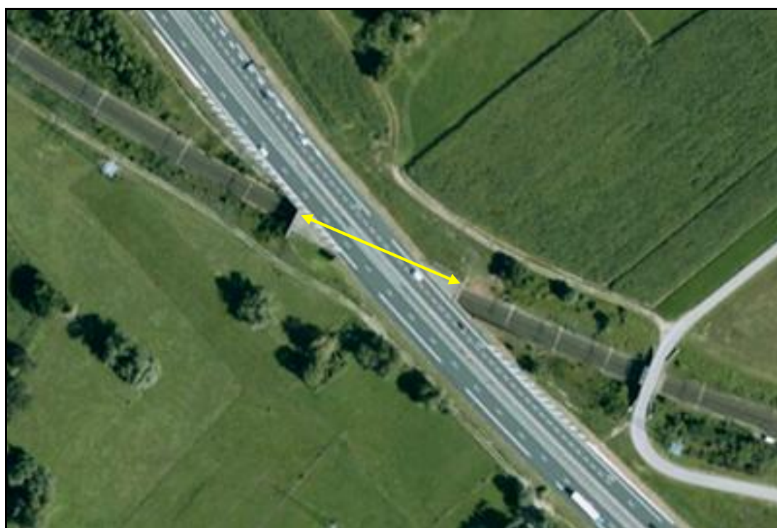
Vue aérienne de la galerie

Quelqu'un a pris mon derrière. Qui prendra mon visage ?