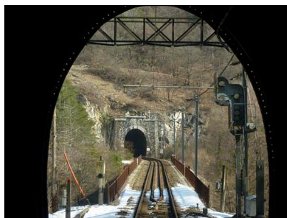
En fond, l'entrée du tunnel des Plaines vue depuis la sortie du tunnel de Saint Marcel