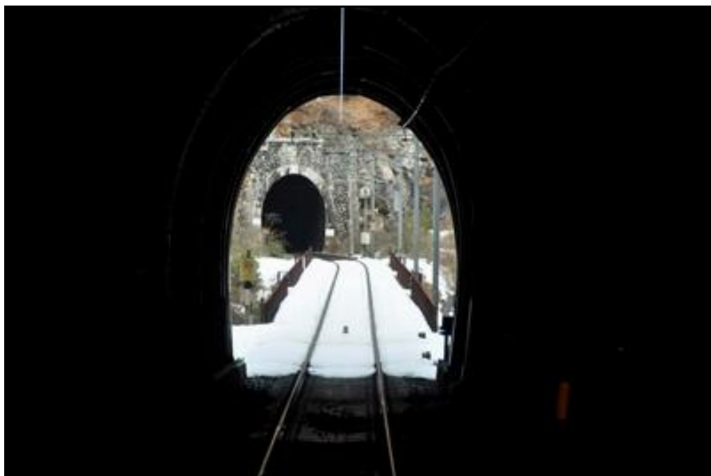
En fond, l'entrée du tunnel des Plaines vue depuis la sortie du tunnel de Saint Marcel