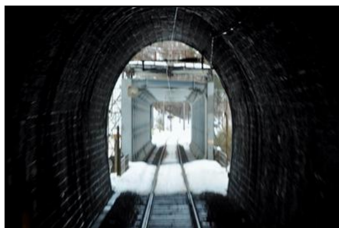
Ci-contre, la sortie du tunnel de Saint Marcel vue de l'intérieur