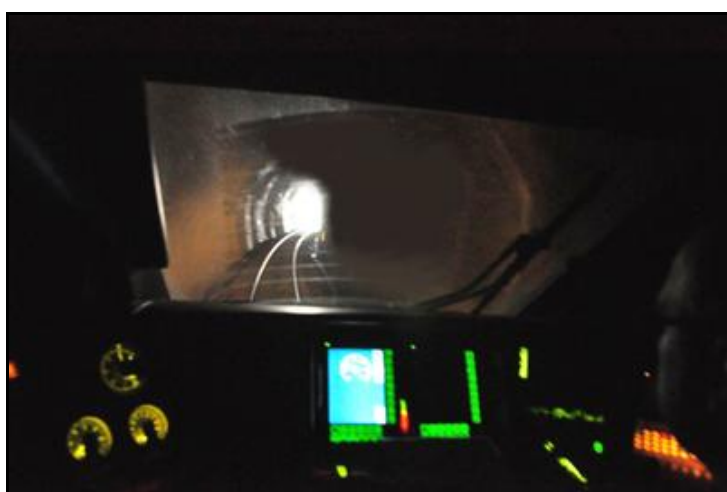
Dans le tunnel

Si cette fiche comporte des erreurs ou des oublis, merci de nous le signaler.