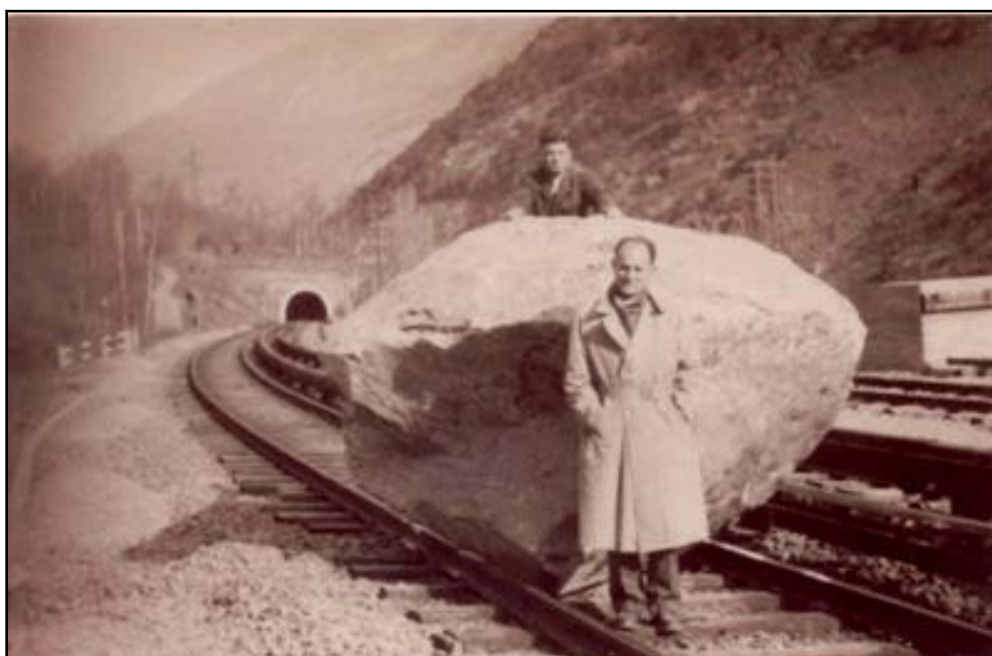
Photo montrant la chute d'un bloc sur la voie avec, à l'arrière-plan, l'entrée du tunnel des Sorderettes Cette photo ancienne montre l'électrification de la ligne par troisième rail avant l'installation des caténaires Elle est aussi antérieure à l'aménagement de l'autoroute qui a bouleversé tout ce secteur

Si cette fiche comporte des erreurs ou des oublis, merci de nous le signaler.