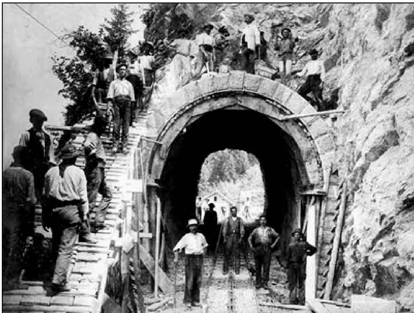
Les ouvriers posent à l'entrée du tunnel de Pré Japert lors de sa construction