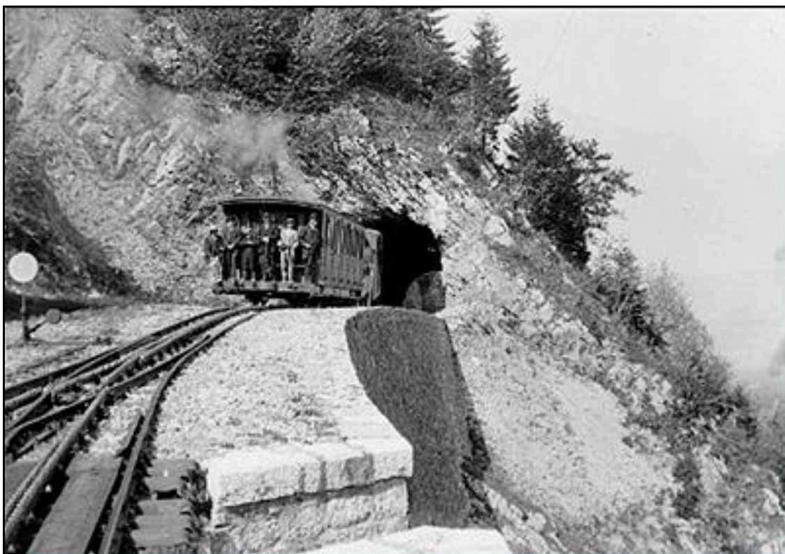
Ci-dessus et ci-dessous, deux vues de la station de Pré Japert et de la sortie du tunnel