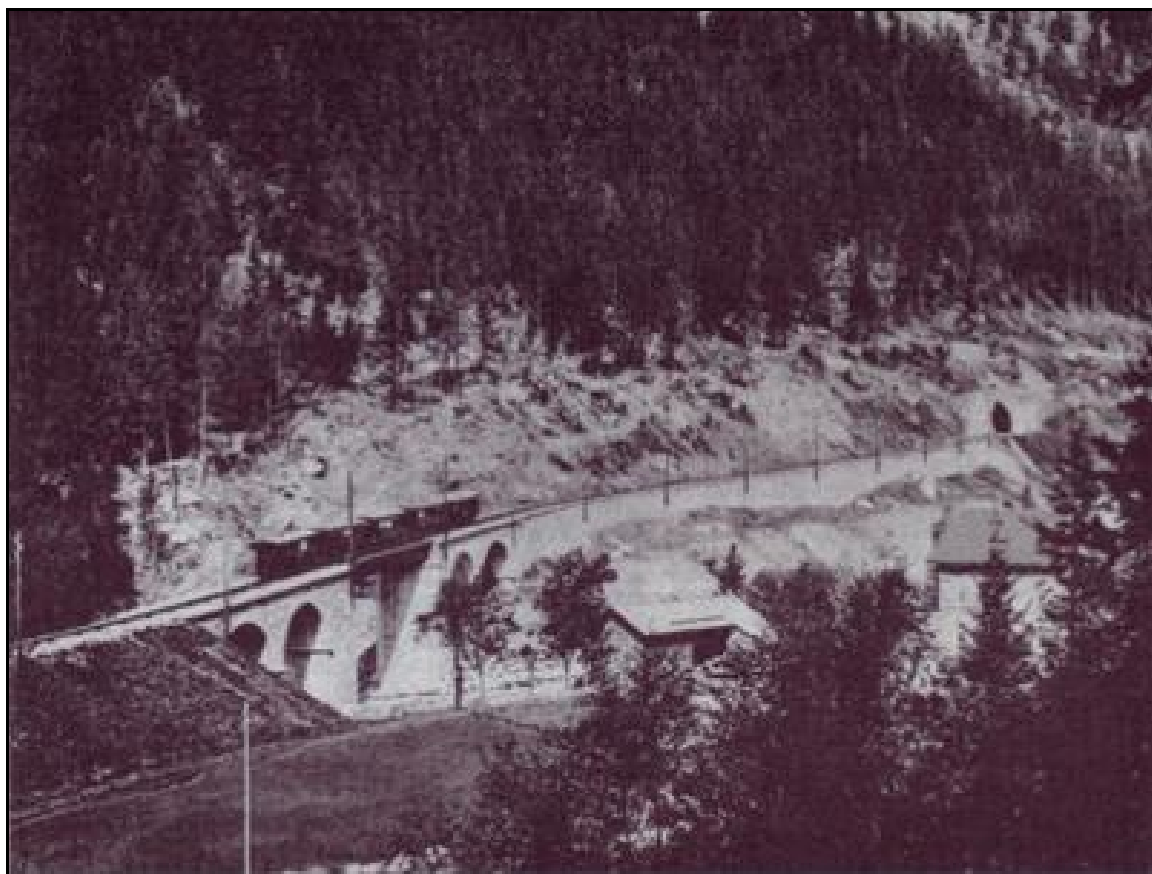
Autre vue de l'entrée du tunnel

Si cette fiche comporte des erreurs ou des oublis, merci de nous le signaler.