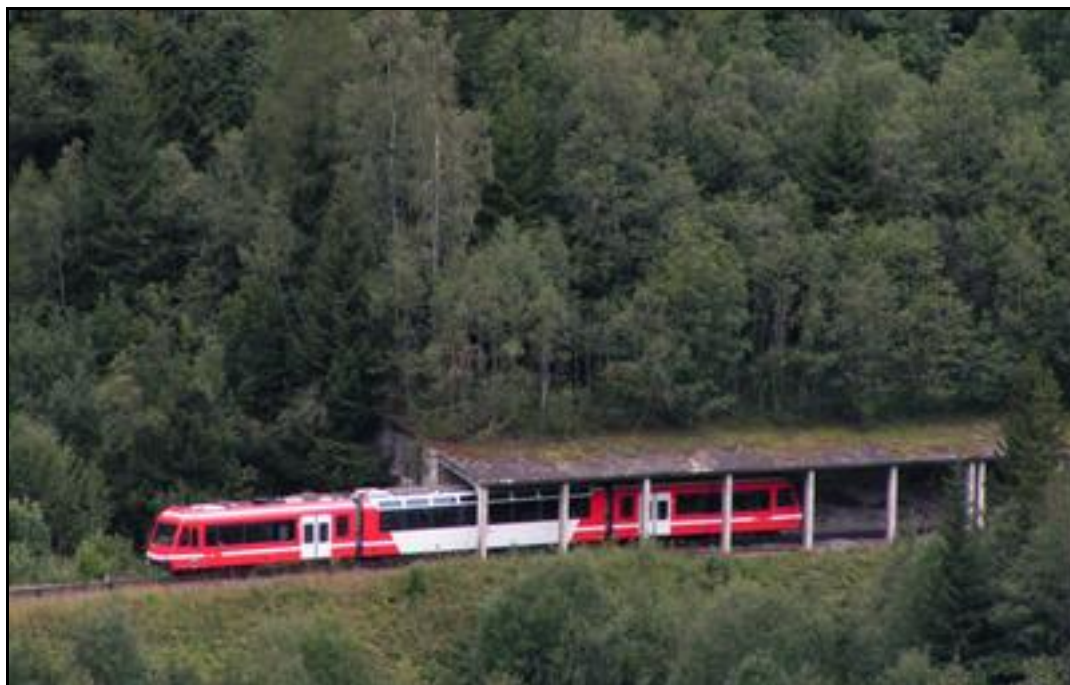
L'entrée de la galerie de Grassonnet

Quelqu'un a pris mon derrière. Qui prendra mon visage ?