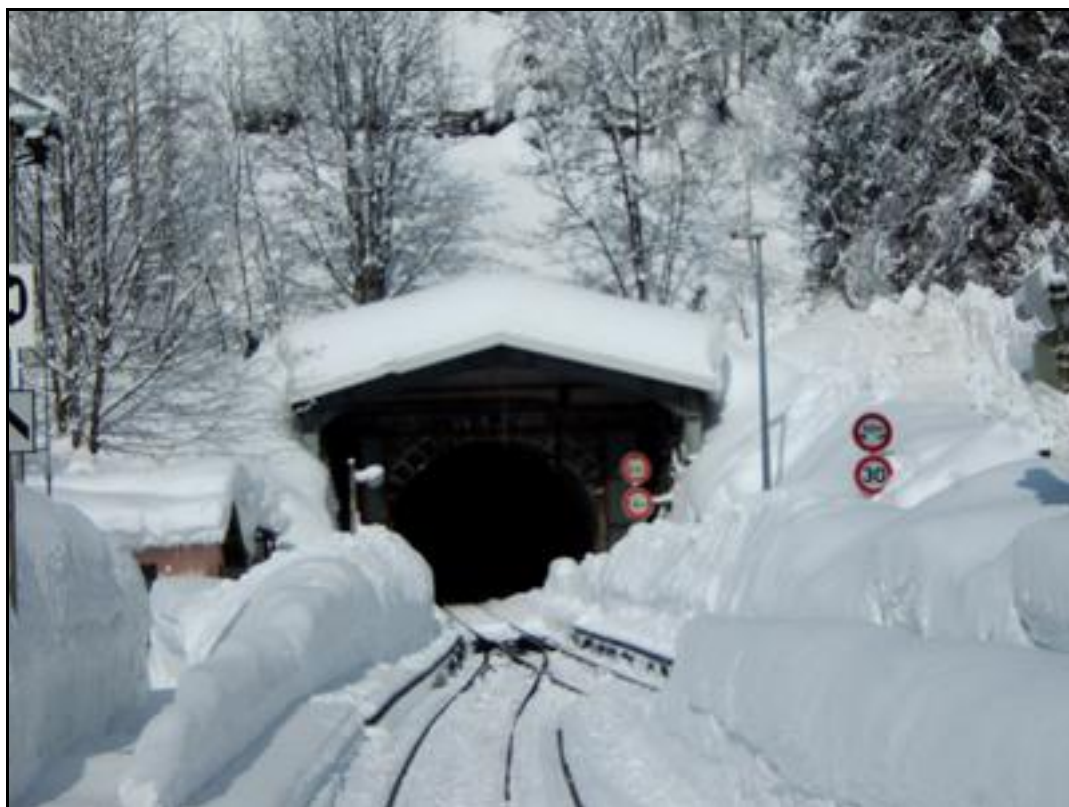
Ci-dessus et ci-dessous, deux hivernales de l'entrée du tunnel et de sa galerie éclairée