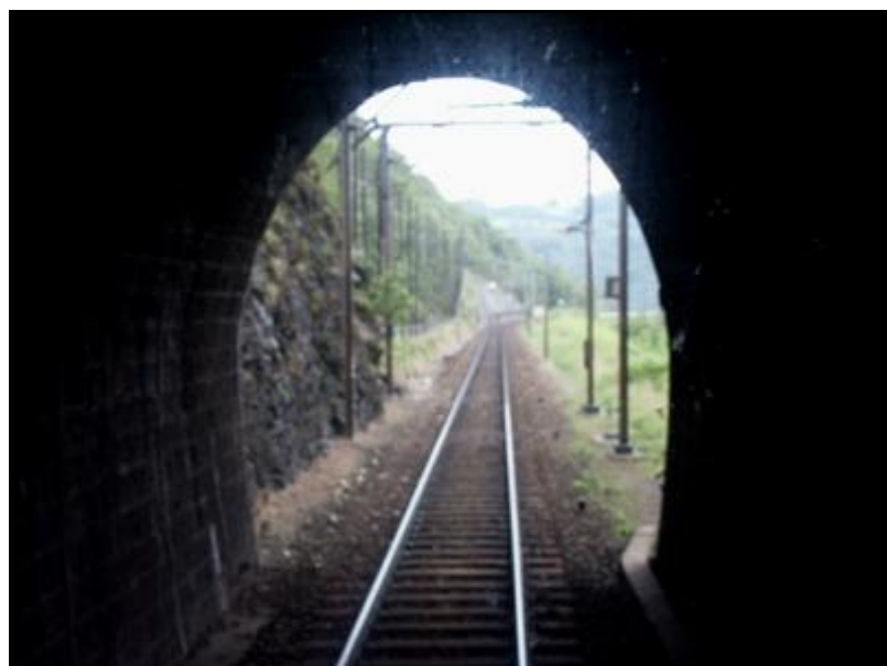
L'entrée vue de l'intérieur

Quelqu'un a pris mon derrière. Qui prendra mon visage ?